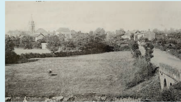
Vue du bourg deuis les côteaux du Paradis

Historique de la rue par le Chant de la Pierre tiré du livre intitulé « Chauché au travers de XX e siècle.