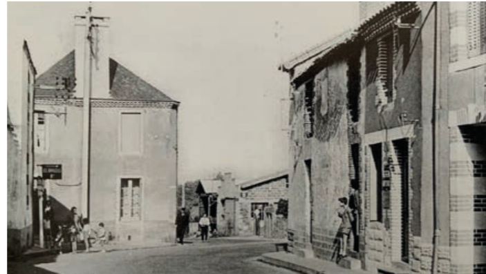
1959, le carrefour de la Forge