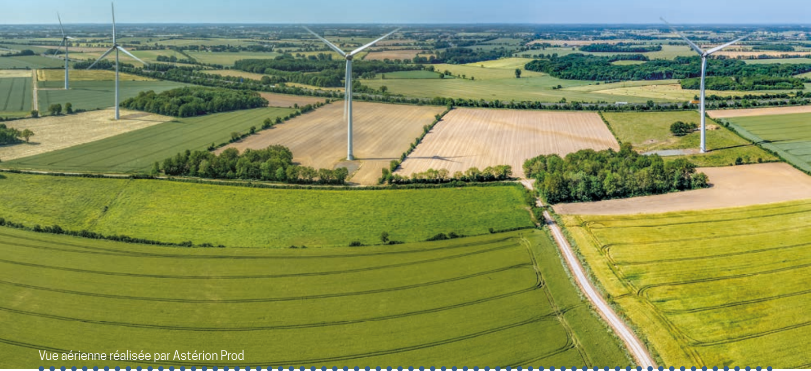
Vue aérienne