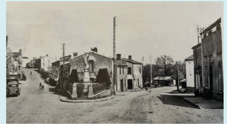
L'entrée du bourg, routes de Saint-Fulgent et de la Rabatelière

2024 : Les travaux doivent débuter le 8 avril, et ce pour une durée de 3 mois.