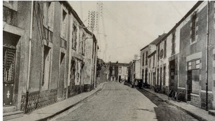
1948, la grande rue.

Historique de la rue par le Chant de la Pierre tiré du livre intitulé « Chauché au travers de XX e siècle.