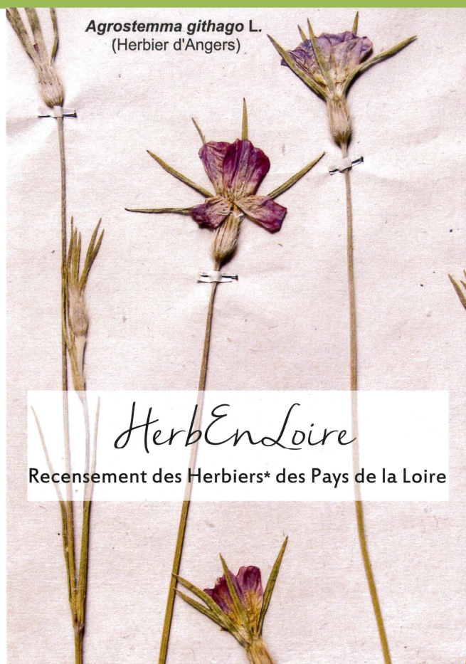
Agrostemma githago L. (Herbier d'Angers)