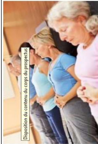
Disposition du contenu du corps du prospectus